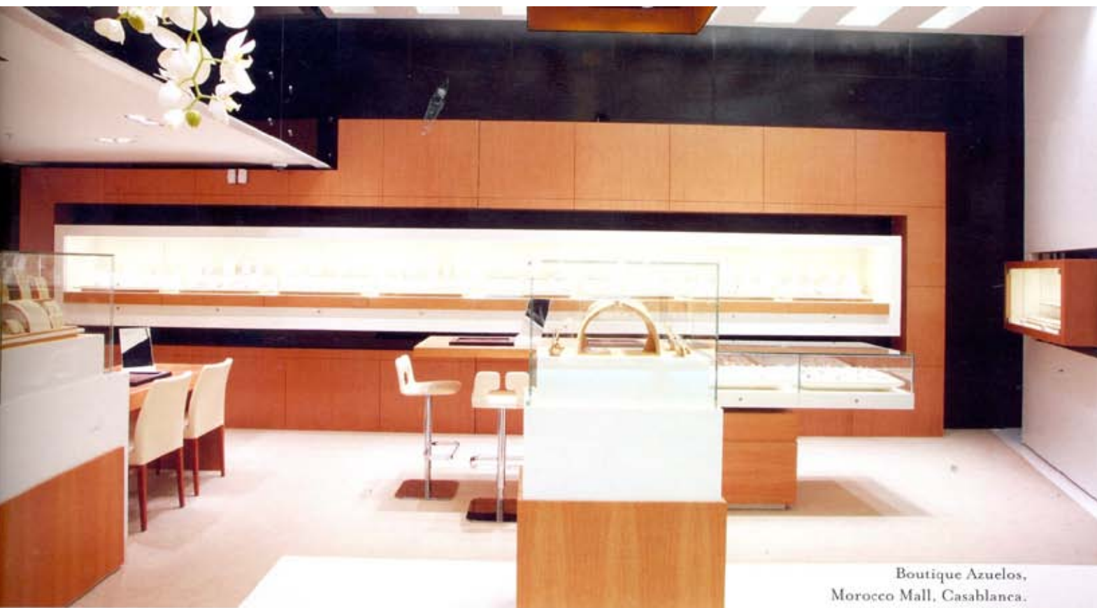
Boutique Azuelos, Morocco Mall, Casablanca.

tion portée aux moindres détails. Nous avons accordé un soin tout particulier à l'éclairage grâce à la nouvelle technologie Led. Côté matériaux, bois de chêne miel et dalles de granit noir contrastent avec les meubles et les plafonds laqués blanc pour mettre en valeur l'éclat des diamants. Par ailleurs, nos créations ne sont pas uniquement exposées dans des vitrines latérales : l'espace est optimisé dans ses trois dimensions grâce à des meubles de présentation situés au centre des boutiques. L'idée est de surprendre le client à chaque instant pendant son expérience de découverte, de susciter en lui l'émotion.