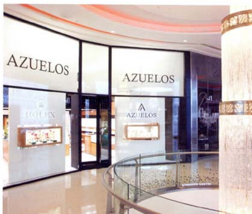
Corner Rolex, Morocco Mall, Casablanca.

Nous avons procédé par étapes. Après l'inauguration de la boutique de l'Agdal à Rabat en juin 2009, nous avons enchaîné avec la rénovation de la boutique du Megamall de Rabat, réouverte début 2011 puis sur l'ouverture de la boutique du Morocco Mall en décembre 2011. Une harmonisation de la boutique Azuelos sur le boulevard Moulay-Youssef à Casablanca est prévue courant 2012.