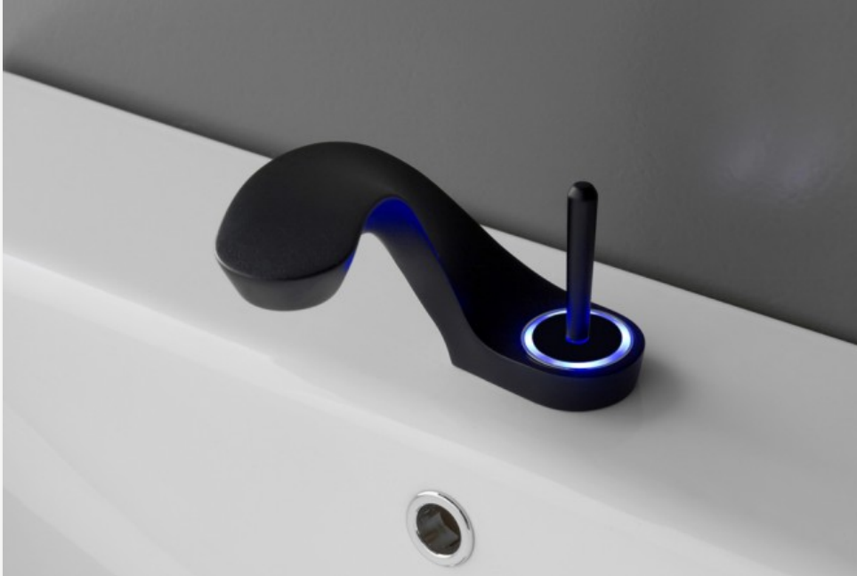
Robinet de la collection Ametis - Design Davide Oppizzi pour Graff

NEWS ECODSIGN INTÉRIEURS HIGH TECH ÉVÉNEMENTS